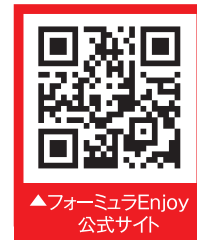
▲フォーミュラEnjoy 公式サイト