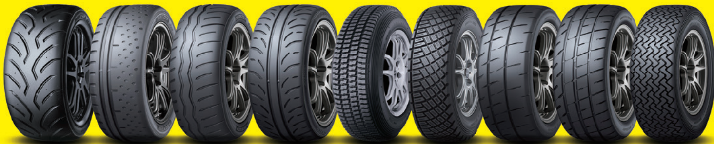
DIREZZA 03G DIREZZA β 02 DIREZZA β 11 DIREZZA Z 11 DIREZZA 74R DIREZZA 88R DIREZZA 301R DIREZZA 201R DIREZZA 95R