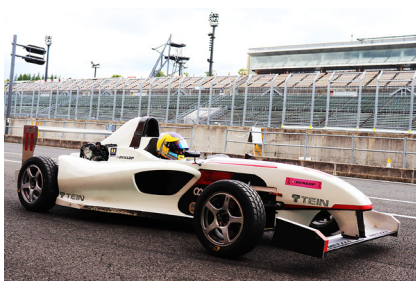
横田 真宏 選手 (ドライバーマン レヴレーシング FE)