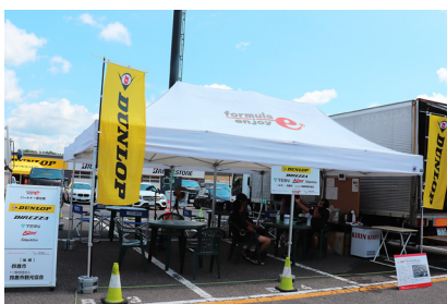
第1パドックに設置された フォーミュラEnjoy協会テント