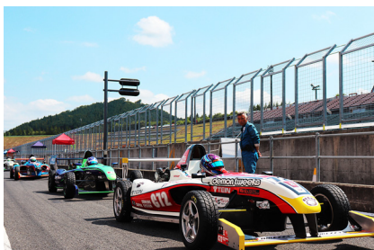
初のもてぎヘコースイン (9日 特別スポーツ走行)