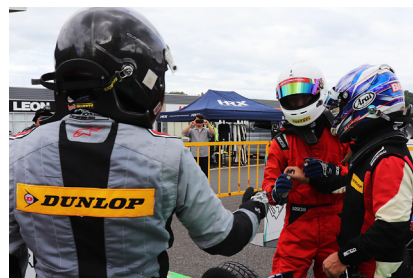
健闘を称えあう上位3選手