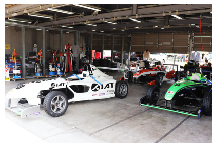
ピットでスタンバイする各マシン