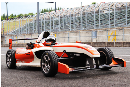
中島 一郎 選手 (barbershop文二 レプリFE)