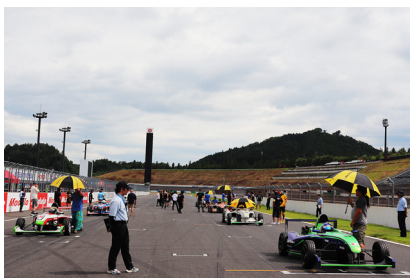
真夏の日差しのもと グリッドに並ぶ各マシン