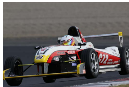
多屋貞一 選手 (K&G クマ工房 萬藤亭 仲生S青海豚 / K&Gレーシング) BG賞 M2位