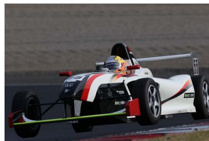
伊勢屋貴史 選手 (御堂土地建物FE2 / グリッド) BG賞