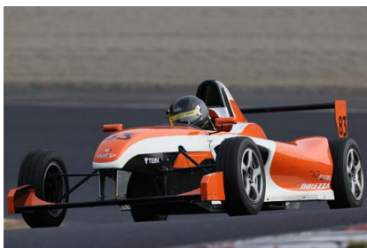
中島一郎 選手 (bar ber Shop 文二 FE-II / レプリスポーツ) BG賞 BR賞 福山賞