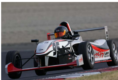
Song Youngkwang 選手 (APPLAUSE FE-II leprix) 福山賞