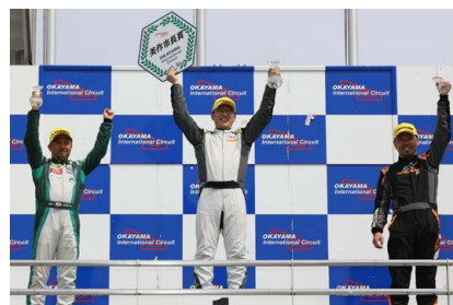
歡喜の表彰台 次回は5月の鈴鹿でお会いしましょう!