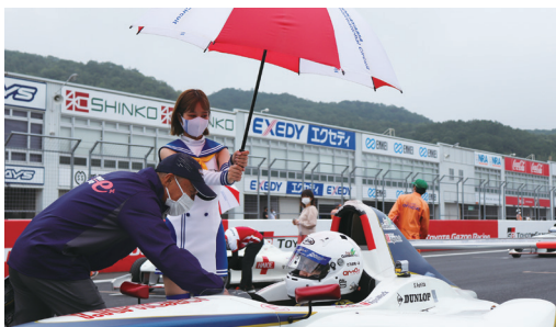
フロントロー2選手には岡山国際サーキットレースクイーンのエスコートが