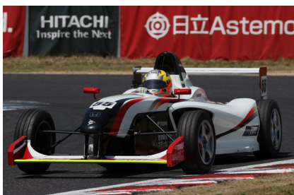
14位 伊勢屋貴史選手 (賃貸経営サポートFE2)