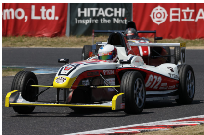
11位 多屋貞一選手 (K&G クマ工房 萬福亭 伸生 青梅豚)