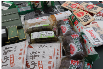
今回の副賞は鈴鹿名産がどっさり! 4位以下の選手に抽選で贈られました