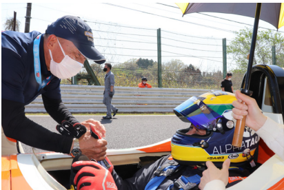
決勝前の選手一人ひとりへの福山アドバイザーの激励フォーミュラEnjoyのFacebookではフルバージョンの動画が観られます