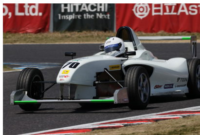
3位 山崎一平選手 (レプリスポーツエンジョイFE2)